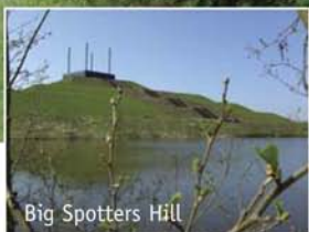
Big Spotters Hill