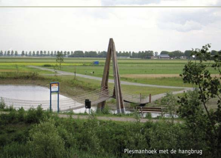
Plesmanhoek met de hangbrug