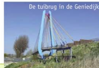
De tuibrug in de Geniedijk

Dit fort in de Stelling van Amsterdam (1889-1897) met café en terras, biedt tegenwoordig als 'kunstfort' expositieruimten. Bijzonder is de dubbele gracht aan de voorzijde: noodzakelijk omdat het voorterrein bij inundaties