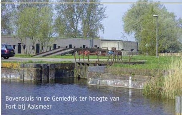
Bovensluis in de Geniedijk ter hoogte van Fort bij Aalsmeer