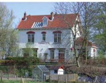
Links: het inmiddels voormalige station Vijfhuizen