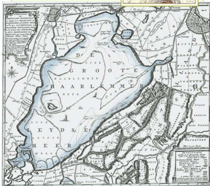
Onder: het Haarlemmermeer anno 1740 (Melchior Bolstra)