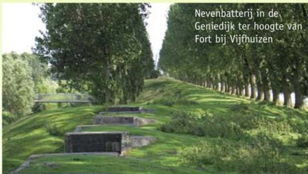
Nevenbatterij in de Geniedijk ter hoogte van Fort bij Vijfhuizen

De Geniedijk vormt met zijn Voor- en Achterkanaal een rechte, groenblauwe verbindinglijn en ecozone dwars door de Meer. Samen met zijn forten, nevenbatterijen en inundatiesluizen maakte deze militaire liniedijk voor de oorlog deel uit van de Stelling van Amsterdam. Een 135 km lange verdedigingsring op ca. 20 km afstand van de hoofdstad en rond 1900 aangelegd. De polder ten zuiden van de Geniedijk kon onder water gezet worden om een mogelijke vijand de doorgang via een 'access' (dijk, weg of kanaal) te beletten. Als monument staat de Stelling sinds 1996 op de Werelderfgoedlijst van de UNESCO.