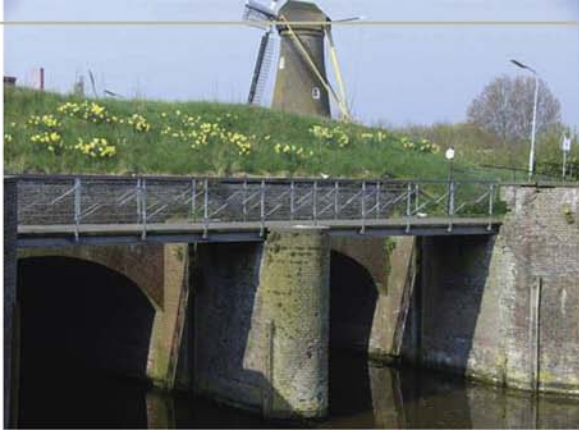
Damsluis en korenmolen De Eersteling