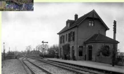
Onder: hetzelfde station anno 1936