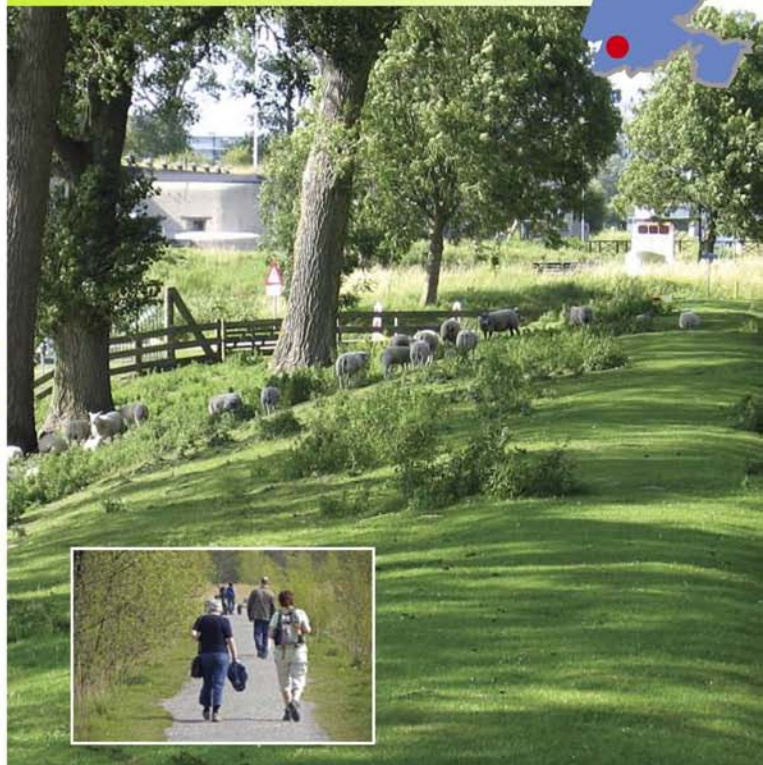
Geniedijk en Fort bij Vijfhuizen